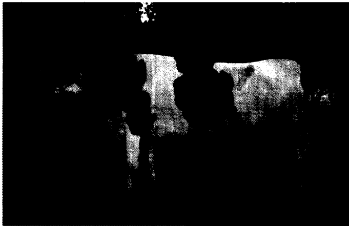
הפרה מכפלה 5824 מקב' עין הנוציב בסוף תחלובתה השלישית, בת פליוזאבוטח