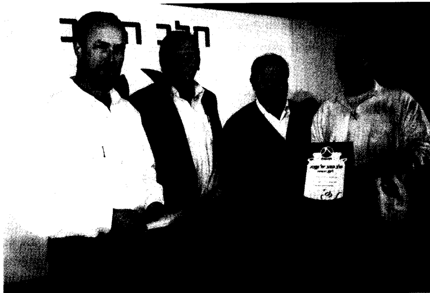
פרס ראשון לנציג הרפת הקיבוצית, קריית ענבים.