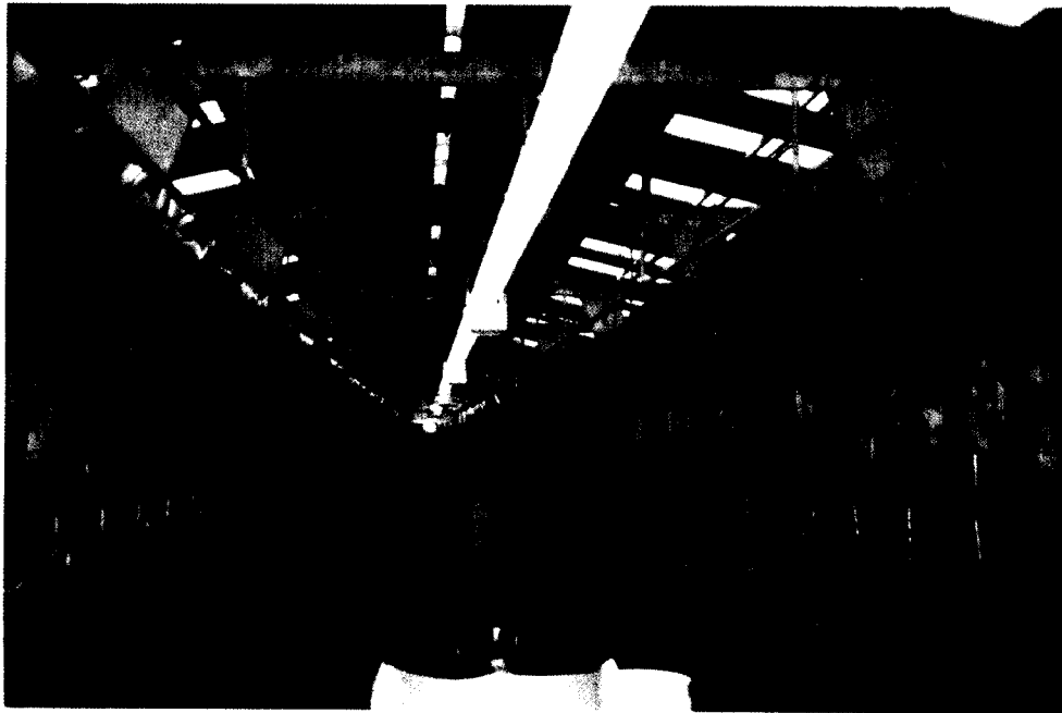
מכון פרלל, 50+50 עמדות חליבה.

עמדות בכל צד – כתוצאה נגרמת פגיעה בייצור, כי תמיד ייפגע הייצור בקבוצות כל כך גדולות ולו רק בגלל ההיררכיה שבין הפרות וכללים בסיסיים של התנהגות בעלי-החיים. וראיתי בעיות קשות ביותר של איכות הסביבה ושמירה על איכות המרבץ של הפרה בריכוז כל