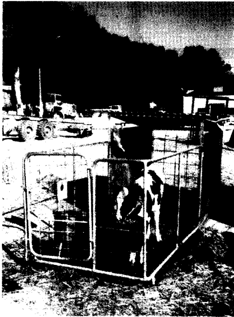
עגלה יונקת לקראת גמילה במלונה פתוחה ומאווררת, בנוסף למתחם פתוח ומגודר (בית אלפא).