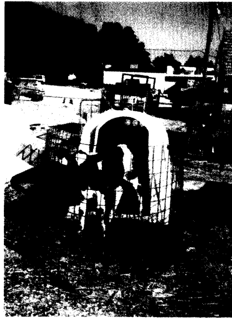
עגלה יונקת לקראת גמילה במלונה סגורה משלושה צדדים עם מתחם פתוח מגודר (בית אלפא).