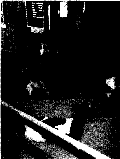
קבוצת עגלות יונקות, אחרי שלב הכלובים, בתוך סככה פתוחה, כאשר גם החצר מוגנת באמצעות יריעת רשת למניעת קרינה חזקה (תל-יוסף).