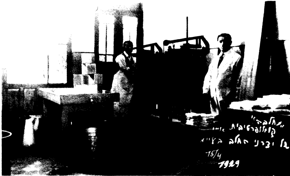
תמונה 3. חדר הגבינה במחלבת "חברת החלב".