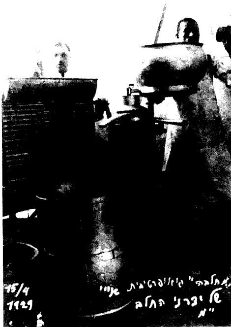
תמונה 1. חדר הספרטור במחלבת "חברת החלב".