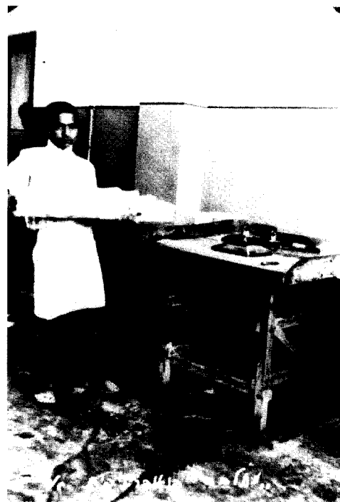
תמונה 4. חדר אריזה במחלבת "חברת החלב".