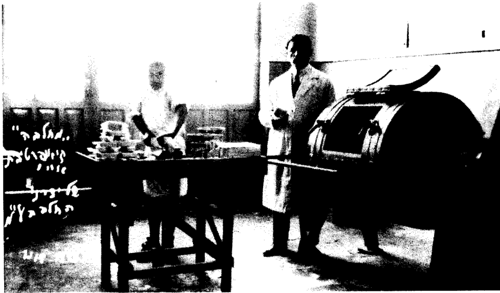
תמונה 2. חדר החמאה במחלבת "חברת החלב".