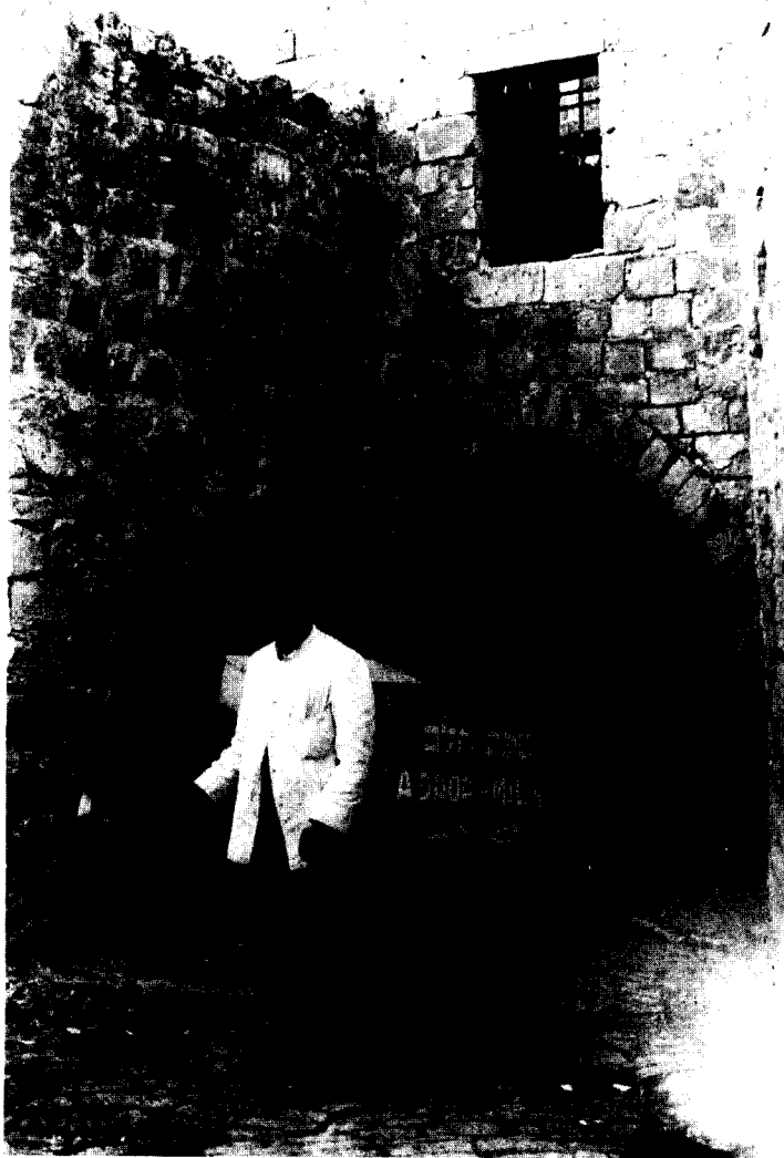
הבאת חלב לעיר העתיקה (ירושלים 1927).

המטבעות. הבן היה מיואש, אבל אביו אמר לו: "אין דבר בני, מה שאספנו בחזרה מן הסיפון הוא שכר עמלנו, ואילו מה שנפל לים, הוא מה שקיבלנו בתמורה למים ששמנו בחלב שמכרנו, והוא חור לים".