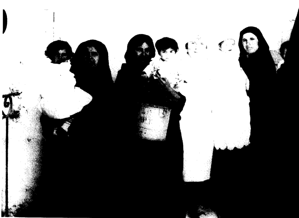
נשים יהודיות וערביות ב"טיפת חלב" בירושלים (1927).