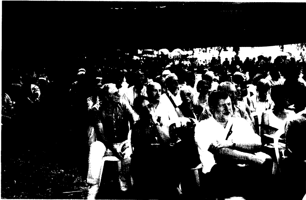
אורחי כנס EHFC ביום החלב.