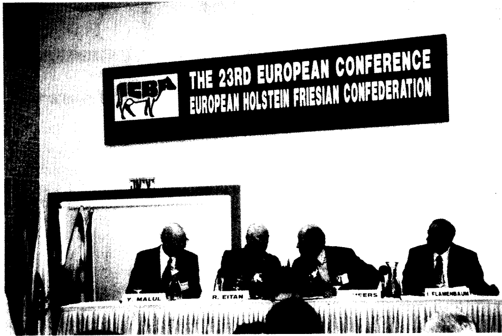
פתיחת הכנס ה-23 של האירגון האירופי של הבקר ההולשטיין-פריזי בהשתתפות שר החקלאות מר רפאל איתן – 80 אורחים מ-19 ארצות ועוד 15 מישראל, בס"ה 17 שפות שונות. מבצע לוגיסטי מסובך שהצליח בכל שלביו לשביעות רצון האורחים והמארגנים כאחד.