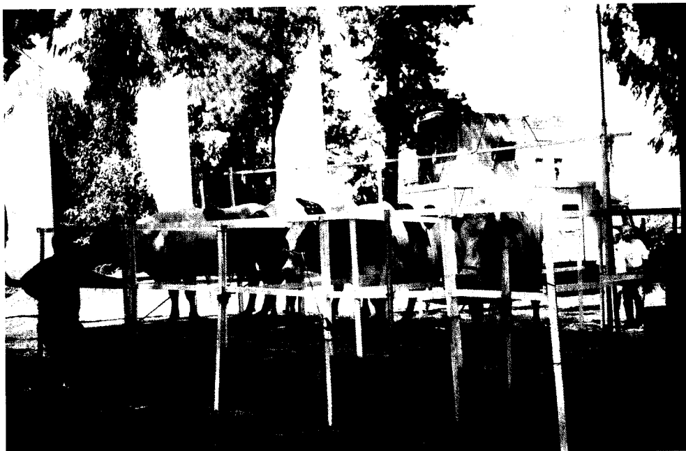
ארבע הפרות, ממש לפני ההתחלה של התחרות בחליבת-יד.

ובראשן "ערפלה" המופלאה. אי אפשר היה להתבונן בפרה ולזהות גם השלט עם תנובותיה וכו'. על הסתכלות מבחינה מקצועית בבנות הפרים השונים כלל אין מה לדבר. אפילו צילום מסכן אחד לא יכולנו להפיק במקום הדחוס הזה.