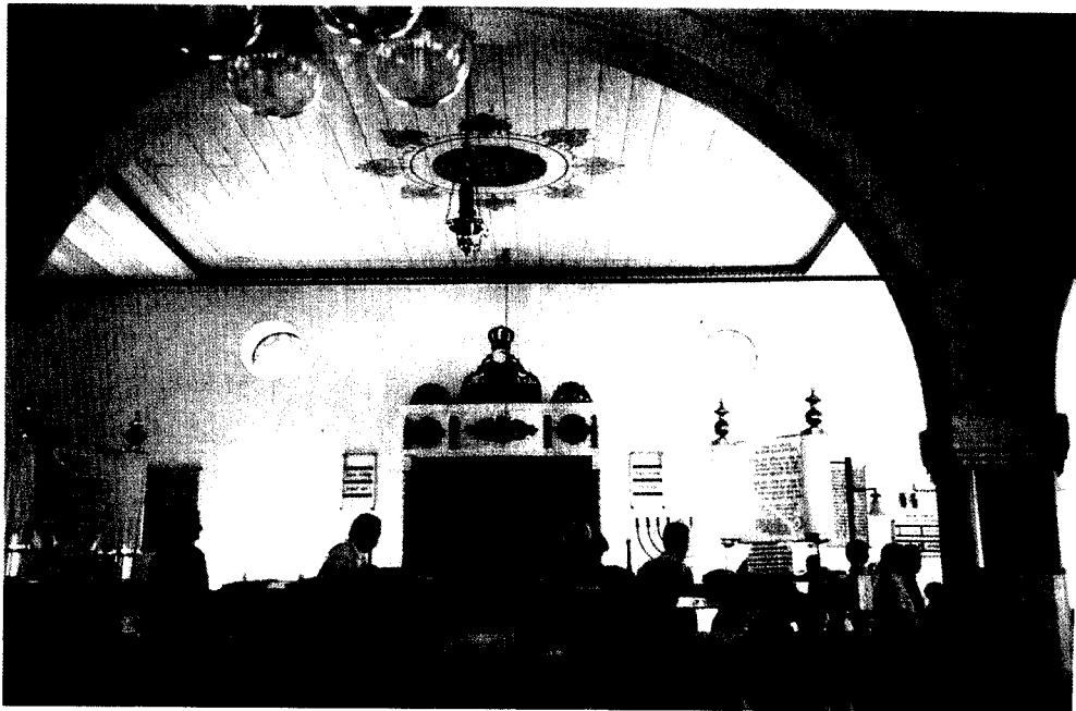
ביקור האורחים בבית הכנסת של מקוה ישראל.

אפשר היה להתרשם ולהיווכח, שמטפחי הגזע ההולשטיין-פריזי הטהור באירופה אינם בדיוק דומים לרפתנים שלנו. שם הם מהווים מעין מועדון מאד ייחודי, לא רק של יצרנים, אלא ובעיקר של מטפחי הפרה היפה המובאת לתערוכות ומתחרה על הפרסים היוקרתיים. ברור, שפרס כזה משפיע מאד על ערכה הכספי של הפרה וצאצאיה ב"שוק הגזעיות" – בעוד בישראל אין לנו שום דבר מקביל או דומה, לטוב ולרע. פשוט, בעולם הגדול מוכנים לשלם